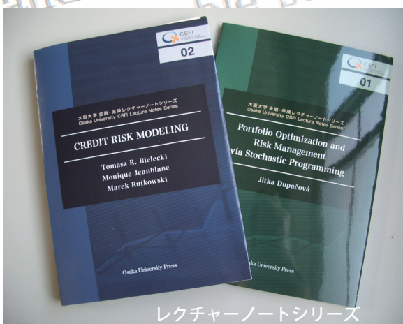
レクチャーノートシリーズ